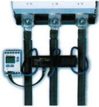
Electronic motor protective relay