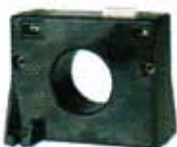
SSW Core-balance transformers หม้อแปลงตรวจจับ ไฟรั่วลงดิน